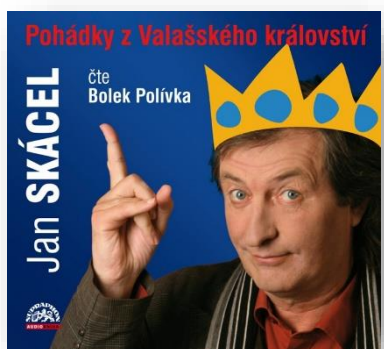
Jan Skácel: Pohádky z Valašského království (Supraphon) čte Bolek Polívka